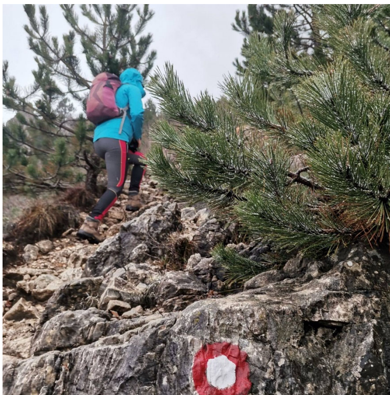
Slika 1: Utrinek s študentskega planinskega izleta 2023 (MK) – dobra volja in optimizem