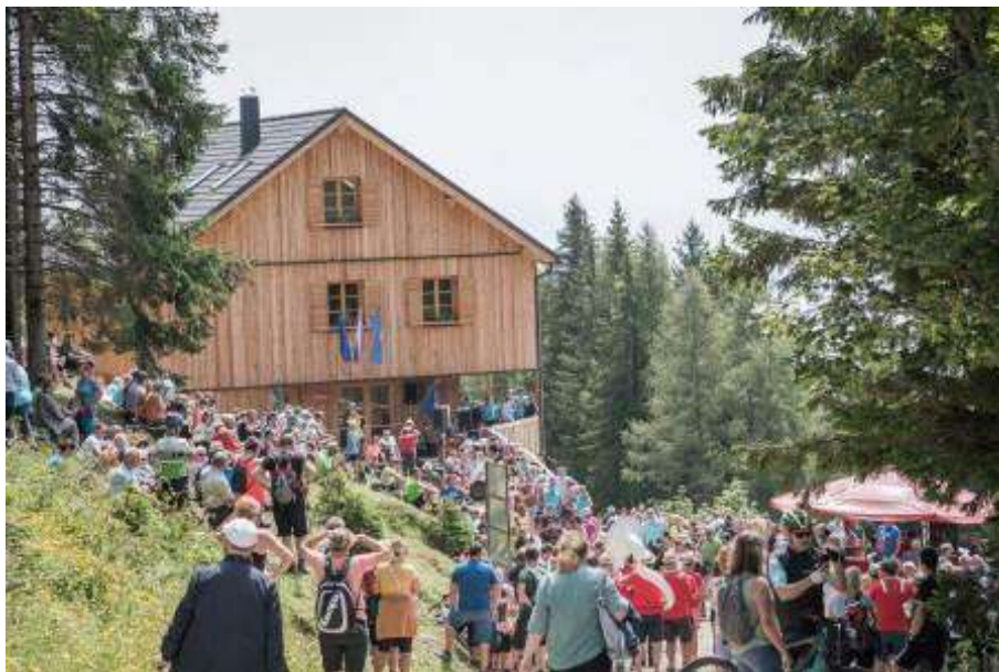
Otvoritev nove Mozirske koč na Golteh

Dodatni redni zbor je potekal 26. 10. 2023, predvsem zaradi predloga za spremembe cenovne politike za planinske koč v še obstoječem koledarskem letu za naslednje leto in zaradi dopolnitve članov organov GK.