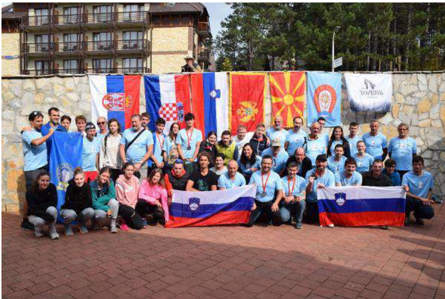
Utrinek z balkanskega orientacijskega tekmovanja v Srbiji

Mladinska komisija je eden izmed najmočnejših členov Planinske zveze Slovenije, ki skrbi za najmlajšo populacijo ljubiteljev planin in gora. Mladinska komisija pokriva različna področja od orientacije, dela mladih, dela za mlade, finančno podpiramo akcije naših članov (mladinskih odsekov) ter jim nudimo strokovno podporo pri njihovem delovanju. V skrbništvu imamo Planinsko učno središče Bavšica in taborni prostor Mlačca, z obema skrbno upravljamo. Sodelujemo na različnih projektih znotraj in zunaj meja Slovenije. Devet let imamo status nacionalne mladinske organizacije ter status mladinske organizacije v javnem interesu v mladinskem sektorju. Sodelujemo z mladinskimi in prostovoljnimi organizacijami v Sloveniji (MSS, ZTS, ZSKSS ...), kot stalni člani Youth Commission UIAA pa smo aktivni tudi v največji mednarodni planinski organizaciji.