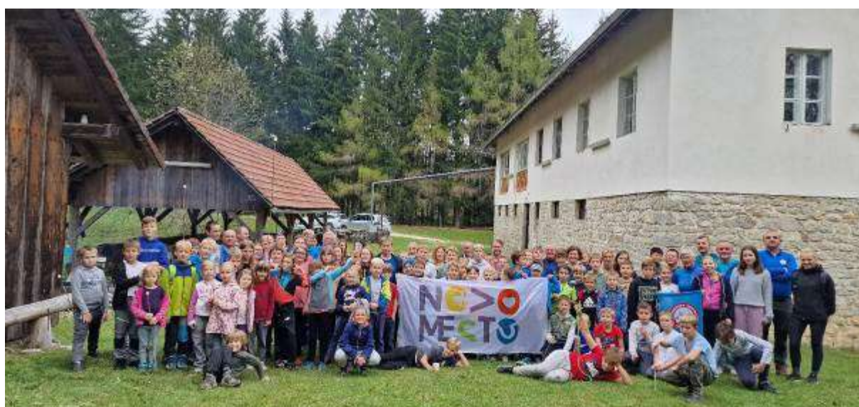
Srečanje mladih in kostanjev piknik v Dolenjem Suhadolu 21. 10. 2023

Tudi v tem letu, so poleg številnih delovnih akcij, ki jih imajo markacisti na poteh znotraj svojih društev, organizirali 17. junija obsežno delovno akcijo MDO PD na območju Metlike, ko so obnovili markacije na poteh Jugorje - Trdinov vrh, Metlika - Krašnji vrh in Krašnji Vrh - jama Pečenjevka, delovne akcije se je udeležilo 45 markacistov, 18. novembra pa še eno delovno akcijo na širšem območju Mirne Gore, v kateri je sodelovalo kar 38 markacistov.