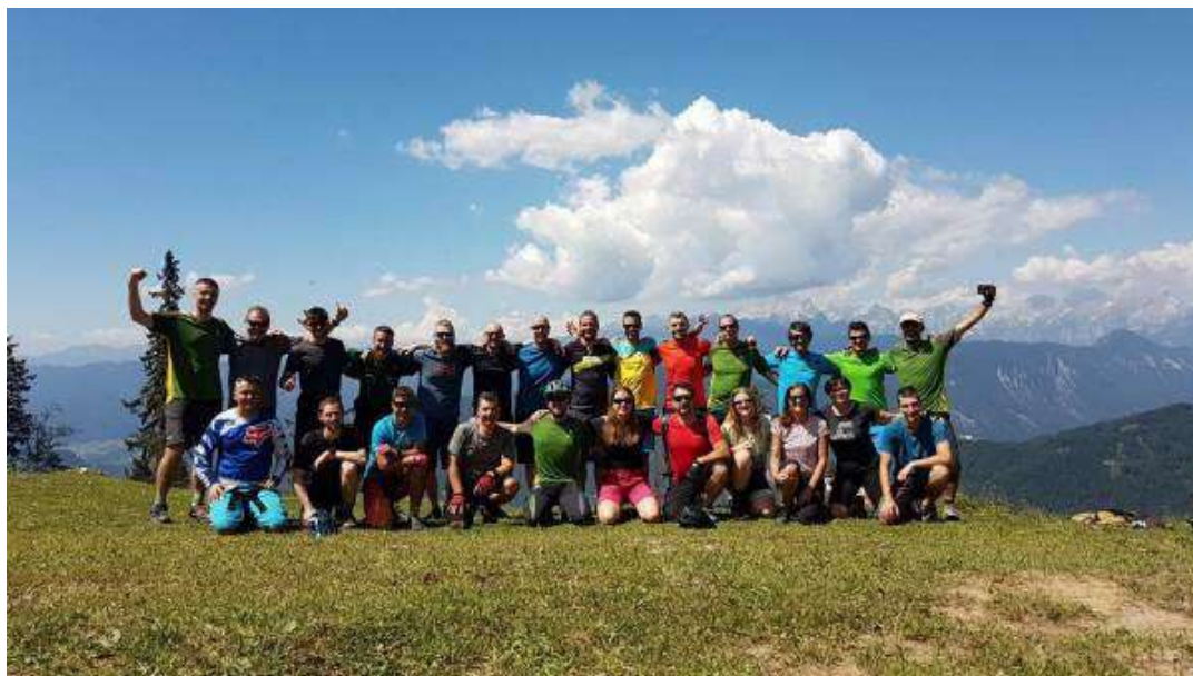
Usposabljanje za TKV 1, Valvazorjev dom.

Kolesarji se odločijo za tisto obliko organiziranosti, ki bolj ustreza razmeram v posameznem društvu.