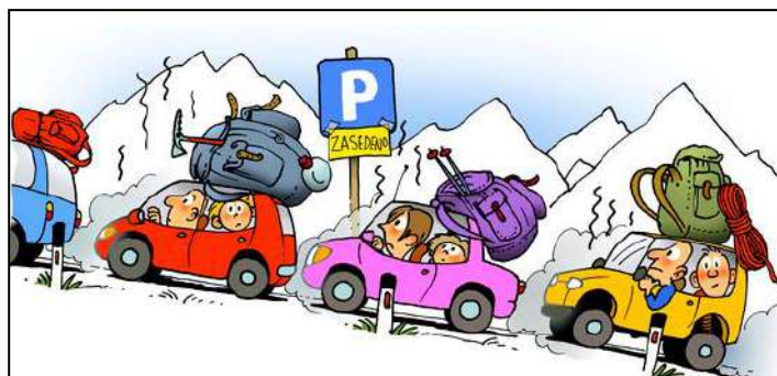
Z avtomobilom do vrha in naprej (iz zgibanke Peš iz dolin do višin). Ilustracija: Samo Jenčič