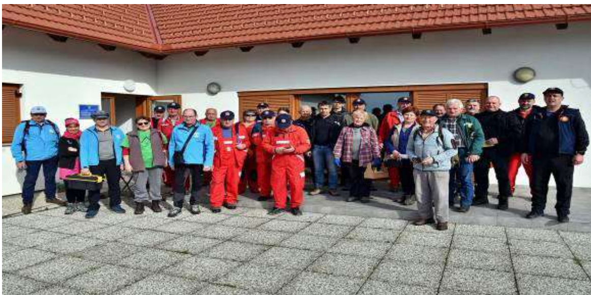
Delovno srečanje markacistov MDO PD Pomurja

Skupni cilji in naloge so na pridobivanju članstva, pridobivanje ustreznega kadra predvsem vodnikov, markacistov in mentorjev mladinskih skupin, spodbujanje mladega kadra, uvajanje planinske šole v društvih, kakor tudi delovanje v PZS, ter sodelovanje s planinskimi in drugimi organizacijami Hrvašk ter Madžarske.