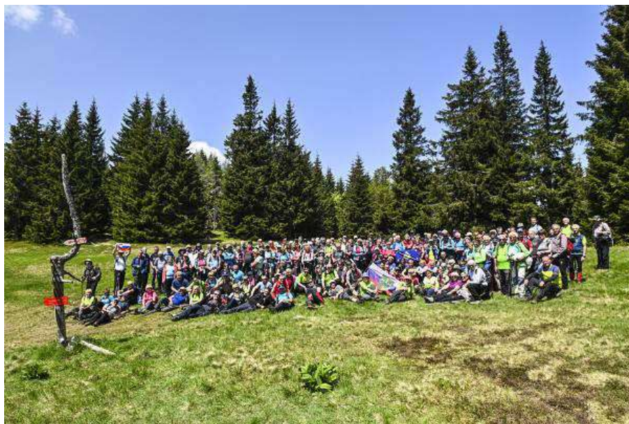
Udeleženci srečanja planincev S MDO PD.

Za dostop do planinskega doma na Smrekovcu smo organizirali brezplačne avtobusne prevoze, prav tako za povratek iz Ljubenskih Rastk na Ljubno. Udeleženci so bili iz 27 planinskih društev, KO ZB Ljubno in Društva za ohranjanje spomina na pohod XIV. divizije iz Laškega. Kljub množici pohodnikov, pa nismo imeli občutka množičnosti, saj so pohodniki z več kondicije pohiteli. Nekateri so se spotoma povzpeli tudi na Smrekovec. S poti smo se lahko razgledovali na vse strani. Najlepši razgledi pa so bili s Komna. Daljši postanek smo imeli na sedlu Hlipovec, kjer so nas člani PD Ljubno pogostili. Ves dan nas je spremljalo lepo vreme.