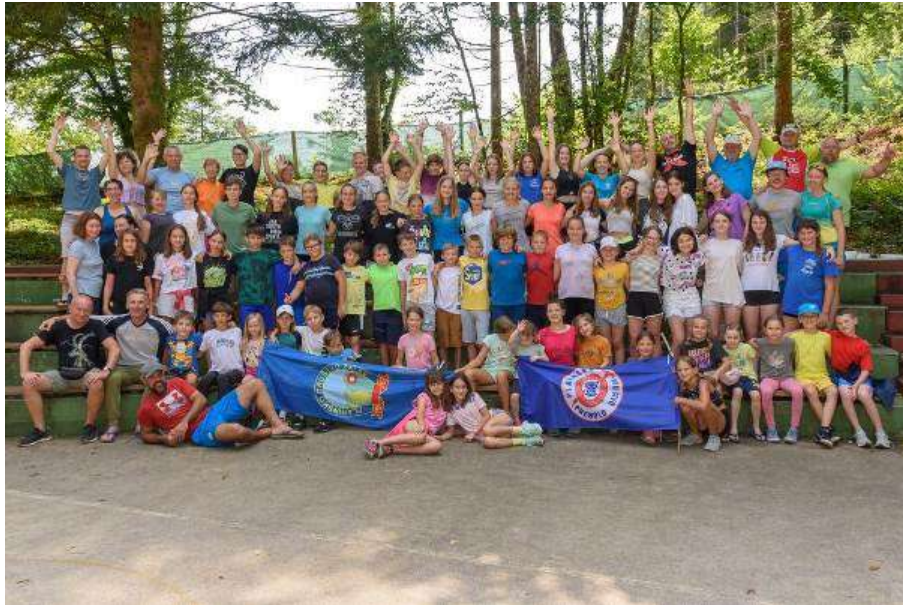
Udeleženci planinskega tabora PD Žalec, PD Galicija, PD Prebold, Tabor Mojca, Dolenjske Toplice